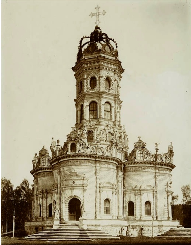
Церковь в Дубровицах

19.11.2015 11:49 - Обновлено 05.12.2015 21:29