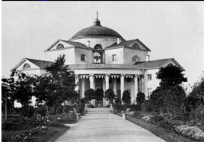
Усадьба Люблино. Фото начала XX века