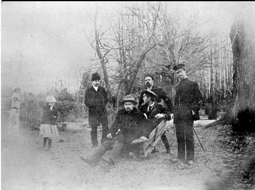
Гиляровский катает Чехова на тачке. Любительское фото. 1890-е